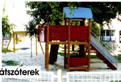
parkolók és játszóterek