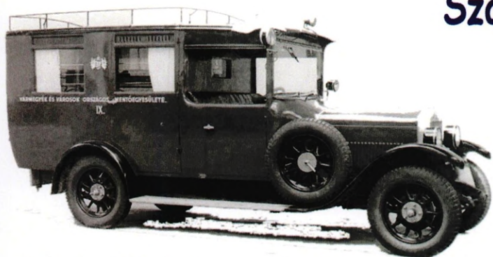
Az első Bajai mentőautó 1929.