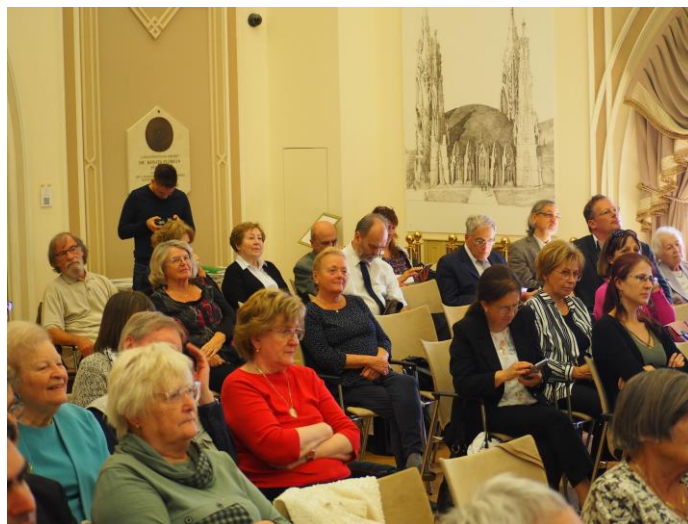
Az emléknep résztvevői

A 30 megemlékezés, mintegy 150 percben, felvázolta Ittzés Mihály munkásságának különböző területeit (habár teljesség nélkül – egyetlen nap a teljesség vázlatához is kevés, a hatalmas hagyaték feldolgozása is még folyamatban van), megidézte munkamódszerének, személyiségének és szellemiségének egy-egy markáns vonását. Kiemelték többek között biztos tudását, szakmai alaposságát, hatalmas munkabírását, önzetlen segítőkészségét, játékos humorát.