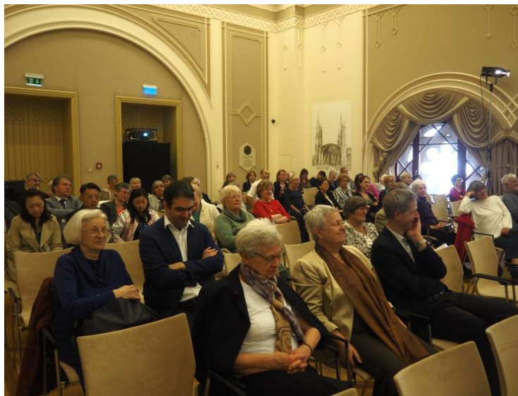
Az emléknep résztvevői