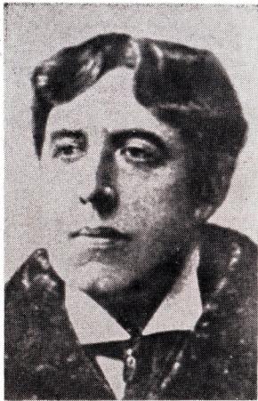
Oscar Wilde (1854—1900)

K evés olyan végletes írói pálya van, mint Oscar Wilde-é. Osztályrésze a gyors, fényes siker, amely a szellemi divat s csaknem egy életforma irányítójává tette – majd a végzetes bukás, a börtön, a nyomor, az öngyilkosság. S még halála után is évtizedekig ő az angol irodalmi élet botránykönyve.