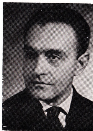
Földes Róbert rendező

A cselekmény művészek világában játszódik, külföldre szakadt, hazavágyó énekesek, revüsztárok, cirkuszi komédiások között. A helyszínek is sűrűn váltakoznak: állomásai Nápoly, a Riviéra és Párizs. Szűk sikátorok és gazdag pompával berendezett Night Clubok adják a keretet a fordulatos, színes történetnek, amely egészséges humorával, szellemesen és gördülékenyen vezet el a végső happy-endhez. Emlékeztetéssé teszik az előadást a látványos táncprodukciók.