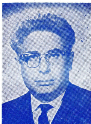
Margitta Gábor rendező

Jó zene, bájos humor, szerelem. Kellő adárolásban összekeverni fenti részeket, ezt jó hanggal és tehetségesen előadni s már mehet is a függöny esténként. Ha ez ilyen könnyű volna! Szerencsére a közönség nem is kívánja tudni, mily nehéz a profizmus jegyeivel ellátni a „könnyű műfaj” példányait, mennyi fáradságba, áldozatos munkába kerül a zeneileg jól csiszolt előadás, mennyi hatáselemzés, mennyi régi és új tapasztalat átgyúrása szükséges egy-egy poen csillogó felröppentéséhez. A közönségnek ez esetben egyetlen jogos kívánsága van: jól szórakozni. Színházunknak is ez a törekvése e darab bemutatásánál.