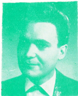
Rigó Jancsi: Sárosi Gábor

Van-e szerelmesebb vallomás, Mint egy szál virág és semmi más?