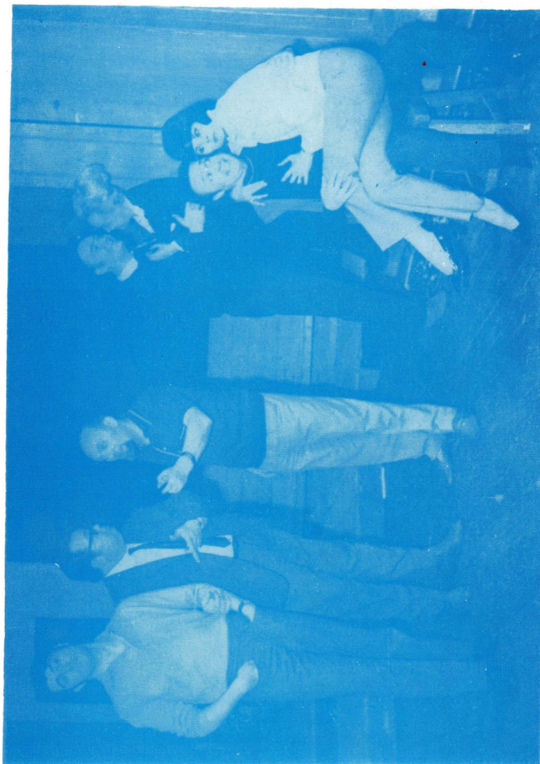
UDVAROS rendező és a szereplők próba közben