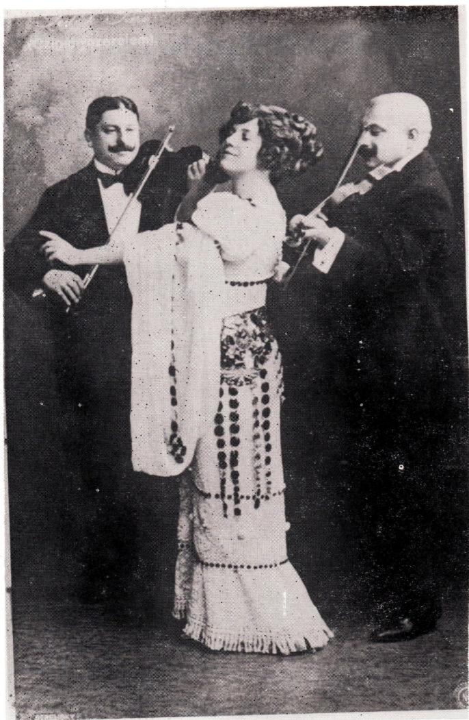
FEDÁK SÁRI A „CIGÁNSZERFLEM” KIRÁLY SZÍNHÁZ 1910-es ELŐADÁSÁN