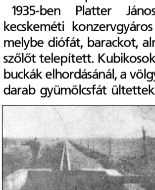
A Platter-telep öntözőrendszere

A Duna-Tisza közti Mezőgazdasági Kamara megbízásából két éven át gyapottermesztéssel is kísérleteztek. Fleischmann neve a szőlő- és gyümölcsnemesítéssel fonódott egybe. Szakképzettsége, ügyszeretete tette nevét fennmaradóvá. A növényvédelemmel kapcsolatban több cikke is megjelent különböző szaklapokban.