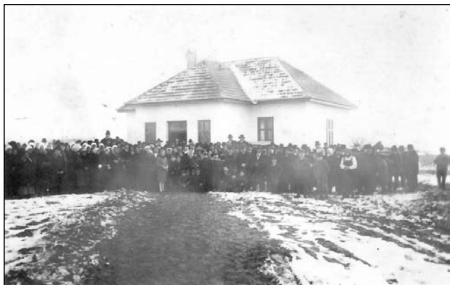
Református Imaház átadása

(Folytatjuk. Szerk.)