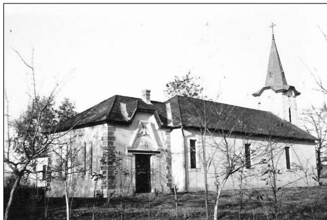
Sikari család temetkezési helye

Szeretettel hívjuk és várjuk a testvéreket alkalmainkra! Éljünk a lehetőségekkel!