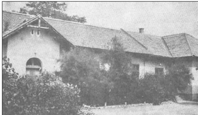
I. számú Selyemhegyi népiskola