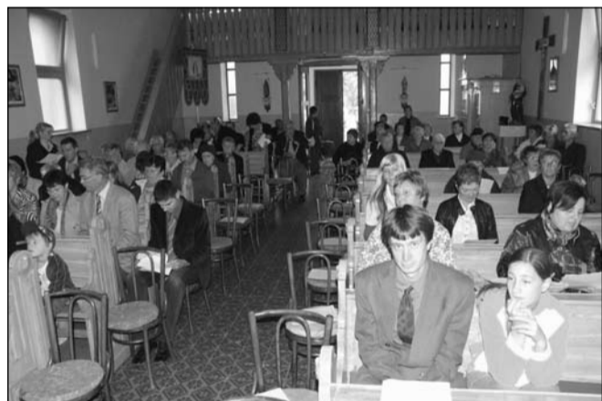
Érdeklődve hallgatták az előadást