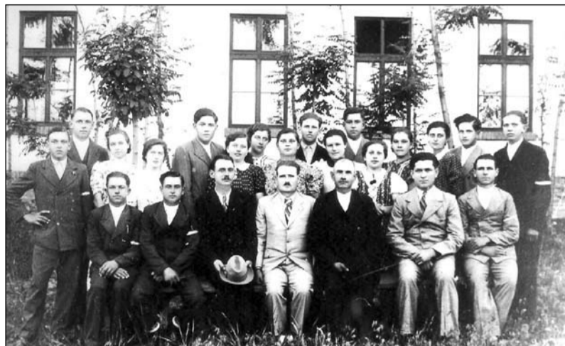
A Gazdakör lelkes tagjai 1940-ben.

A Magyar Kommunista Párt politikája kedvező visszhangot váltott ki a lakosság körében, amiz az is bizonyít, hogy a Gazdakörben megrendezett gyűlésekre az érdeklődők fele sem fért be.