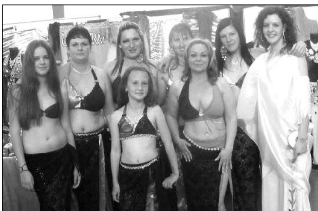
II. Budakalászi Orient Expon lépett fel hastáncos csapatunk május 8-án