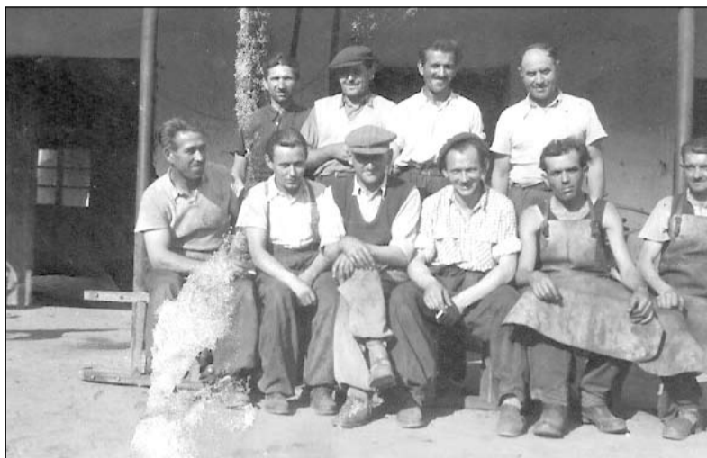
Az Ágasegyházi Kerület kovácsműhelyének dolgozói

A Platter féle birtokon üzemelő gazdaságot az Izsáki Állami Gaz-