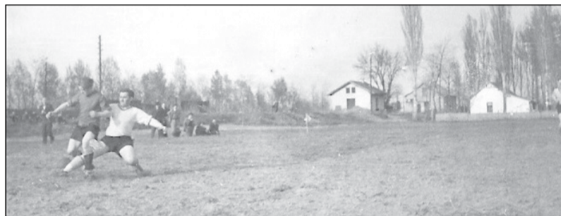
Régi idők focija

A villamosítás beindulása, a szocialista átszervezés nagy léptekkel beindítja a község fejlődését. A rengeteg társadalmi munka mellett, a pihenésre és szórakozásra is igényt tart a megfáradt lakosság.