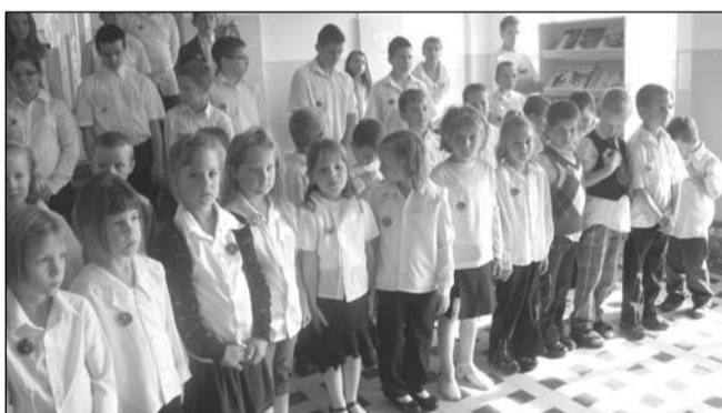
A Széchenyi jelvény feltűzése

A Széchenyi Focitornát rendeztünk a csarnokban. A 3.-4. osztályos csapatunk második lett. Sajnos, a 7.-8. osztályos fiúk csak negyedik helyezést értek el.