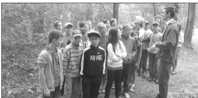
Az erdei séta közben

Szeptember 16-án az 5. osztály egy délelőttöt tölthetett el Hetényegyházán a Nyíri Erdőben a Vackor Vár Erdei Iskolában. Egy másfélórás erdei sétával kezdődött a nap. A vezető az erdő mindennapjairól, állatairól, növényeiről mesélt. Közben pedig láthattunk is érdekes dolgokat. Ezután két csoportra osztottak minket. Az egyik csoport tagjai az íjásztudásukat teheték próbára. A másik csoport pedig emléket készített az erdei iskoláról. Fát csiszoltunk, majd állatok, növények képeit égettük rá forró vassal. Megnéztük az iskola kiállításait is. Nagyon jól éreztük magunkat! 5. osztály