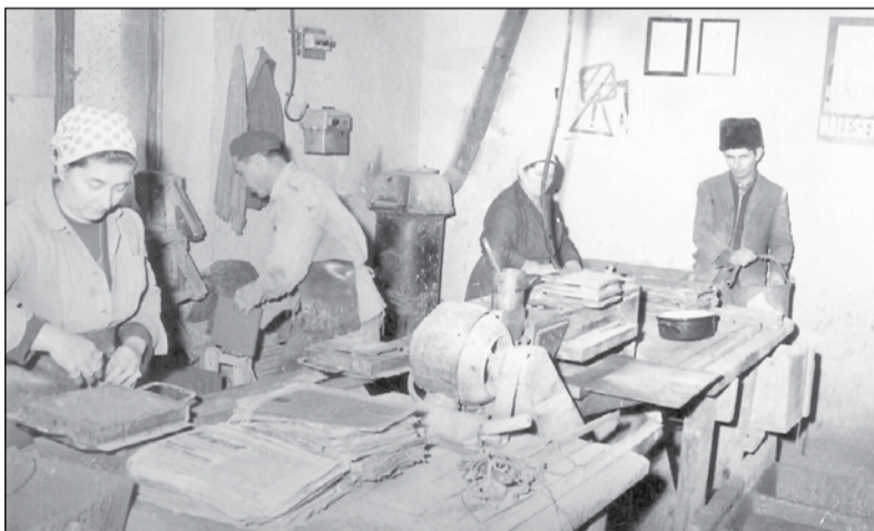
Nagy ütemben folyik a mozaik lapok gyártása

A felsorolt tevékenységek mellett figyelemre méltó erőfeszítéseket tesz a tagság és a lakosság igényeinek kielégítésére is. Így pl.: gépkölcsönzést végez, növényvédőszer- és műtrágya ellátásáról is gondoskodik. Eredményes munkát végeztek a szerződéses termelés területén is.