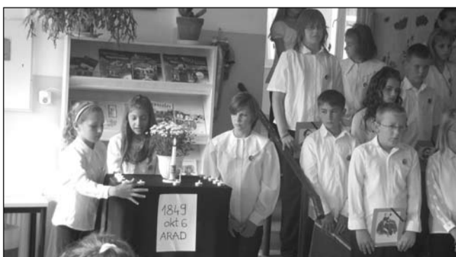
Részlet a műsorból

Az 5. osztályos tanulók ünnepi műsorával emlékeztünk az ARADI VÉRTANÚK halálának évfordulóján.