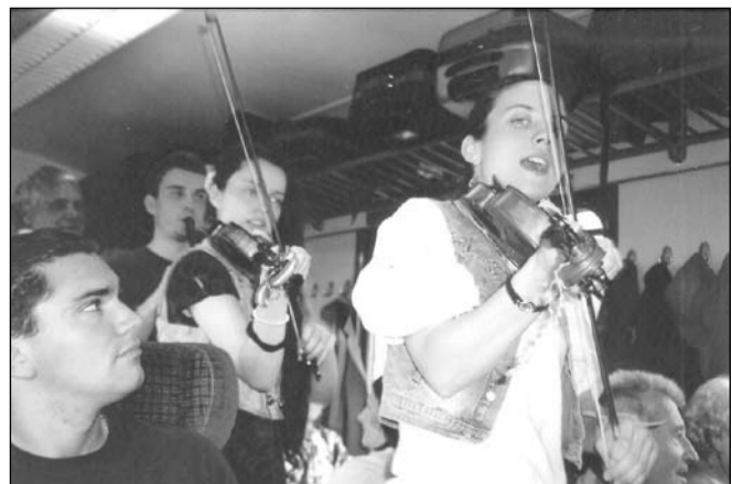
A vonaton zenével búcsúztatnak bennünket az erdélyiek

Szórád Istvánné egy zarándok a sok közül