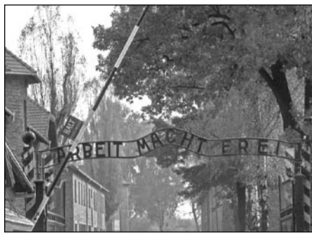
A haláltábor bejárata

1945. január 27-én az első ukrán front néhány katonája lépett be elsőként az auschwitzi haláltábor kapuján. A látvány döbbenetes volt. Halottak mindenütt, az élők pedig emberi roncsok voltak csupán. 1942-45 között majd 2 millió ember pusztult el a legnagyobb náci haláltáborban. 2006-tól január 27. - az ENSZ határozata alapján - a holocaust nemzetközi emléknapja. A világon mindenütt megemlékeznek a népi-irtás áldozatairól, a körülbelül 6 millió emberről, aki már soha nem térhetett vissza az életbe.