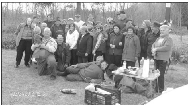
Gazdaköri tagok és barátaik