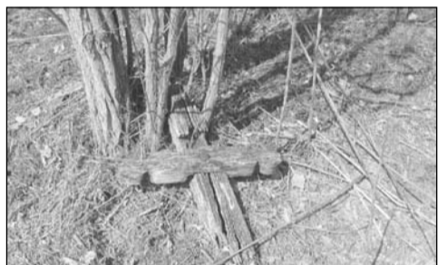
Ilyen volt ...

Daruhát... Daruháti temető... Ízlelgetem a szót. Valami régi, valami elfeledett, de mégis hazánk ágasegyháziakhoz tartozó jelentéssel bír még napjainkban is. Ez az a hely, ami felszínileg egy futóho- mokból összefűjt magaslát, vagyis „hát”.