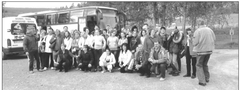
„Mi” a vendéglátókkal