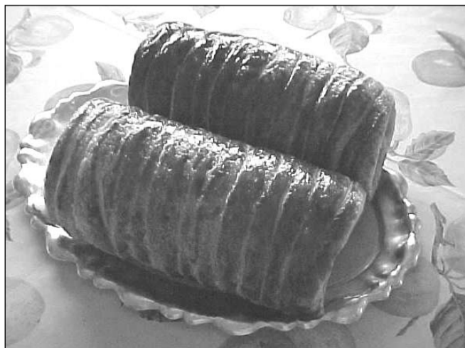
A frissen sült, meleg kürtöskalács

Megint kiöntött a Kormos és elvitte a termést,