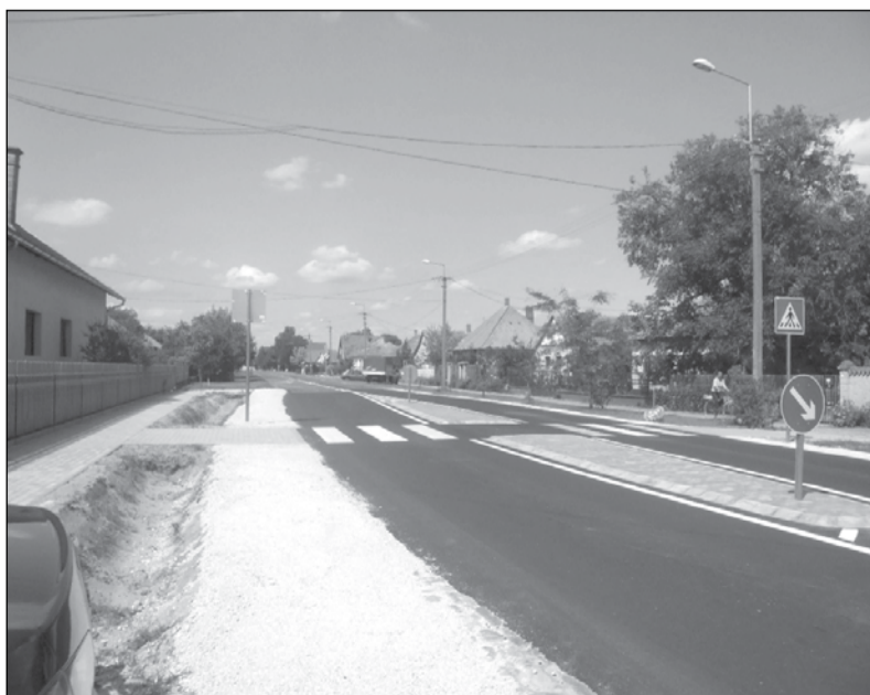
és ilyen lett.