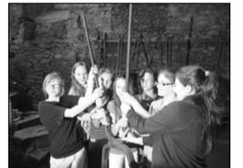
Kovácsmühely 35 kg-os fogója, amit a hat lányunk alig bírt felemelni

Különleges volt, hogy van egy másik testvérvárosuk is, Csehországban, akikkel most találkoztunk. Nagyon-nagy sikere volt a magyar virtusnak! Szerencsére a zene minden nyelven egyformán szól, a tánc is áthágja a nyelvi akadályokat: a közönség végig tapsolta a táncot, amit a kis színpad miatt a díszterem közepén kétszer táncoltak el, először az egyik oldalon, másodszer pedig, a másik oldalon ülő nézőközönség felé. Népdalokat éneklő lányaink is kétszer mutathatták meg tudásukat, egyszer a főtéren felállított színpadon, és este a búcsúvacsorán. Büszkék vagyunk