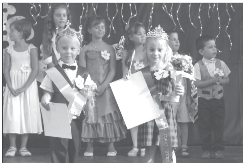
Az első szépség választás igazi megmérettetéssel (produkcióval, utcai és estélyi viselettel) és nagy-nagy sikerrel Ágasegyháza