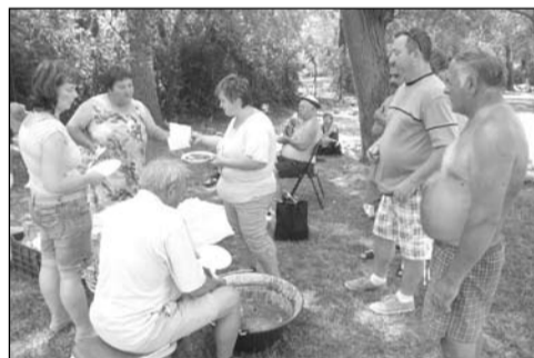
Déli illatok csalogatója