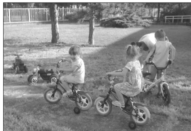
Ilyenkor még a járműveken is meg tudunk osztozni