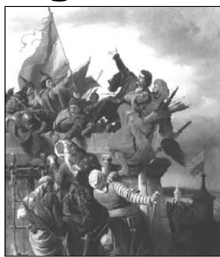
Dugonics Titusz önfeláldozása

A pápa, III. Calixtus még a csata előtt rendelkezett, hogy déli harangszó szólítsa imára a híveket Magyarországot szerte a keresztény világban. A pápai bulla kihirdetésének idejére azonban már a győzelem híre is megérkezett az európai városokba.