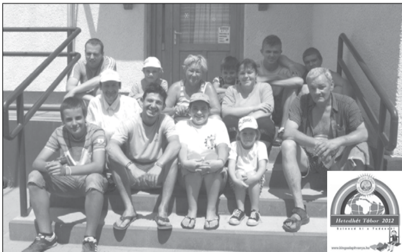
Az előkészítők csapata