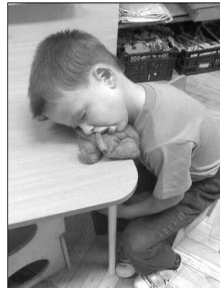
Aludni bárhol lehet, de Trombival az igazi

autózni, mindenkinek jut és az sem baj, ha a nagy hőségben néha beszaladnak a locsoló alá, vagy sárosak lesznek, hiszen ennyi gyereket gyorsan le lehet zuhanyozni. Nagyokat lehet aludni, nem fontos a megszokott időben kelni, mert kevesebben gyorsabban végzünk. Sokan ilyenkor nyílnak meg igazán, lesznek bátrabbak, közlékenyebbek, mert sokkal több idő van beszélgetni, játszani velük, kétszemélyes alkalmakat teremteni.