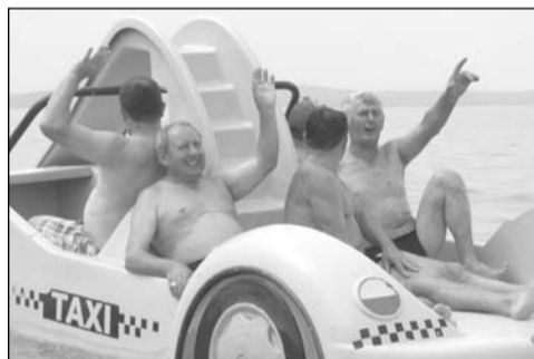
Jókedvű taxis utasaink