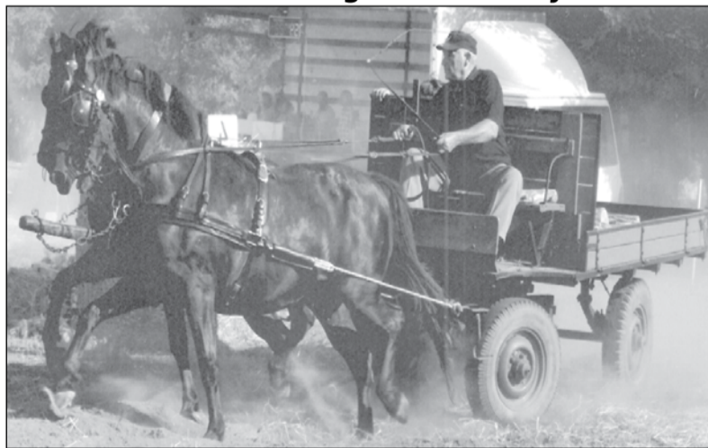
Lovas barátok példás összefogása