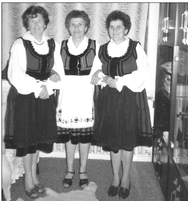
Az erdélyi tanító nénik egyik csoportja népviseletben.