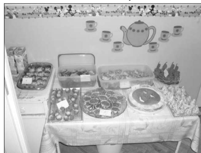
A finomságok egy része