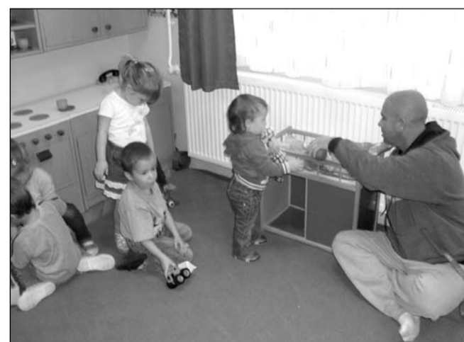
Voltak akik játszottak...