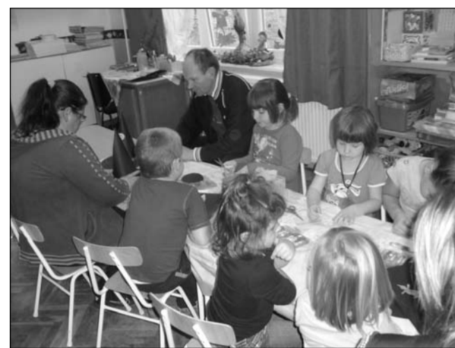
Készülnek a kalapok