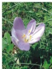
2. Őszi kikerics