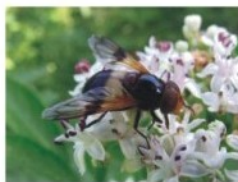
3. Üvegpotrohú légy