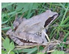
1. Erdei béka